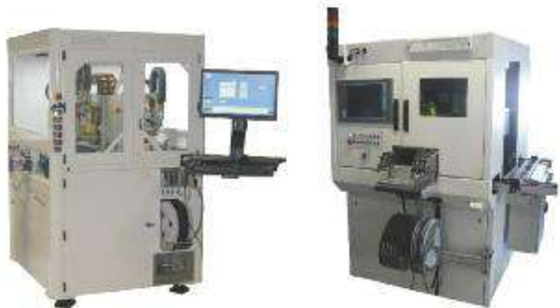
Applications dans l'optique, la robotique, le nano-positionnement...

(1) Les sociétés ISP System, Bihurcrystal, Graphene NanoTech avec l'Institut des matériaux de Barcelone (ICMAB, CSIC), l'Institut des sciences des matériaux d'Aragon (ICMA CSIC), le Centre de Physique des matériaux (CFM, CSIC), l'Institut catalan de nanosciences et nanotechnologie (ICN2), l'Université de Saragosse (Unizar), le Synchrotron Alba.