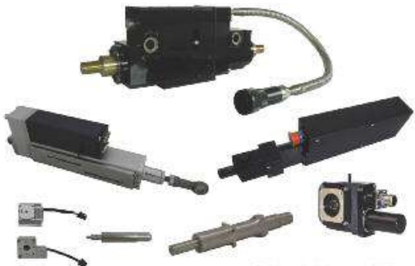
Electrical embedded actuators - ISP System